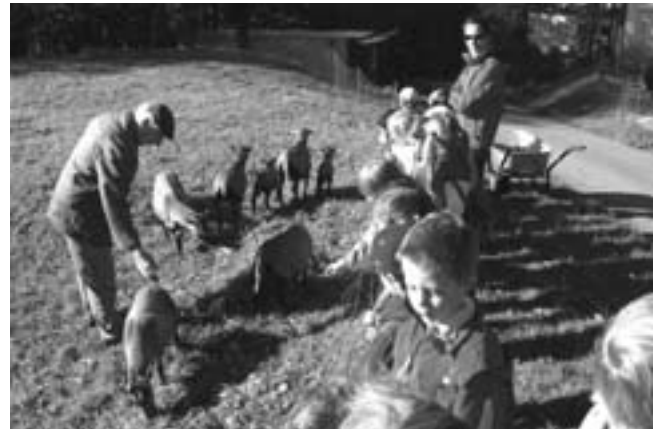
Bei Ehrenfried Geuze waren wir bei der Fütterung des Damwildes und der Kamerunschafe dabei.