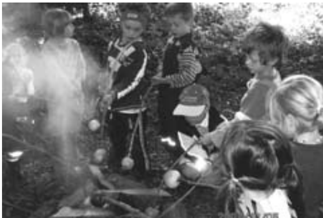
Erntedankfeier im Schollamoos